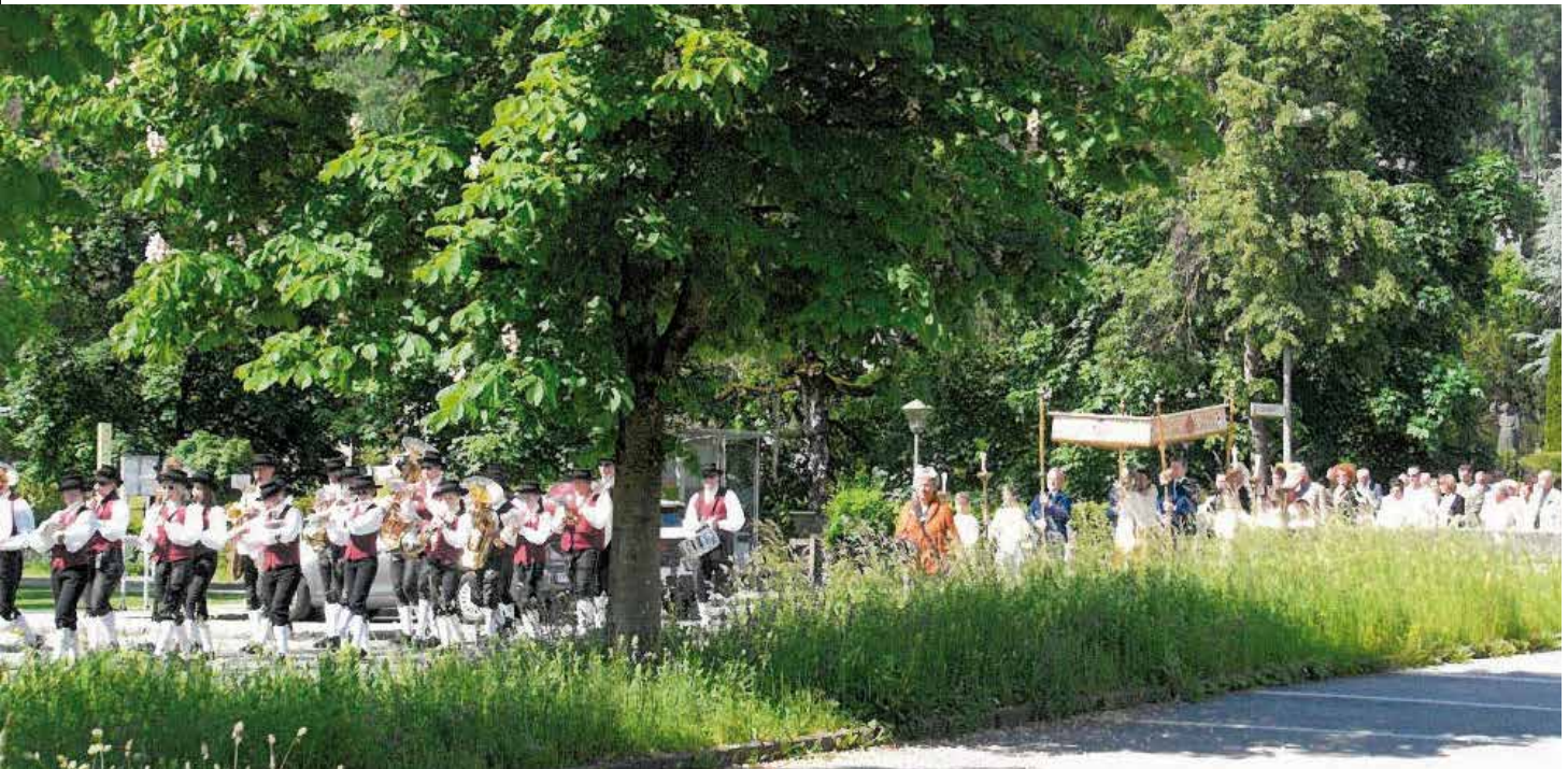
Der Musikverein führt den Prozessionszug an.

Die Sorge um das Gedeihen der Felder und Früchte und die Bewahrung vor Unwetter (Hagel, Blitzschlag, Überschwemmung) drängte die Dorfgemeinschaft, speziell in früheren Zeiten, zur Anrufung überirdischer Mächte. Bittgänge haben eine lange, bis ins Frühmittelalter zurückreichende Tradition. Der katholische Wetter-Segen ist ein traditionelles Gebet, oft unterstützt mit einem Reliquiar, meist eine prächtig kunstvoll verzierte Monstranz. In unserer Pfarre beherbergen wir eine wertvolle Wettersegensmonstranz aus der späten Barockzeit, laut Aufzeichnung aus dem Jahre 1742, aus Wien. Der Wettersegen wurde oft in der Zeit zwischen dem 25. April, dem Markustag, und dem 14. September