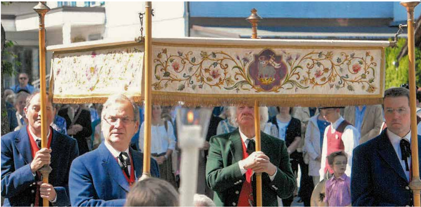
Der „Himmel“ wird durch die Schmittengasse getragen.

Am Markustag, 25. April, nach Göfis. In der Bittwoche am Montag nach Beschling, Dienstag um die äußeren Felder, Mittwoch um die inneren Felder. Am Christi Himmelfahrtstag über die Saminabrücken. In einem Dorf, das im Laufe der Jahrhunderte so viele Überschwemmungen erleben musste, ein verständlicher Brauch. Am Freitag nach Maria Ebene, am Samstag „Zu Unserer Lieben Frau“ nach Rankweil. Am Donnerstag vor Pfingsten nach Nenzing. Den Höhepunkt brachte das Fest Fronleichnam, mit der prächtigsten Prozession.